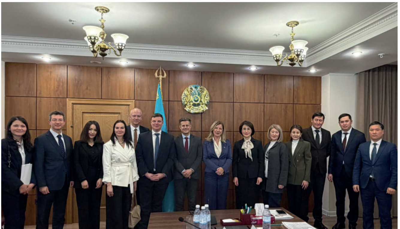
Am 27. Februar 2026 fand in Astana die vierte Sitzung der Arbeitsgruppe EU–Kasachstan zum Marktzugang im Gesundheitswesen und zur Gesundheitspolitik statt.

Gleichzeitig wurde betont, dass die Einführung elektronischer Rezepte, digitaler Beschaffungsverfahren und der Arzneimittelkennzeichnung bereits messbare fiskalische Effekte erzielt und