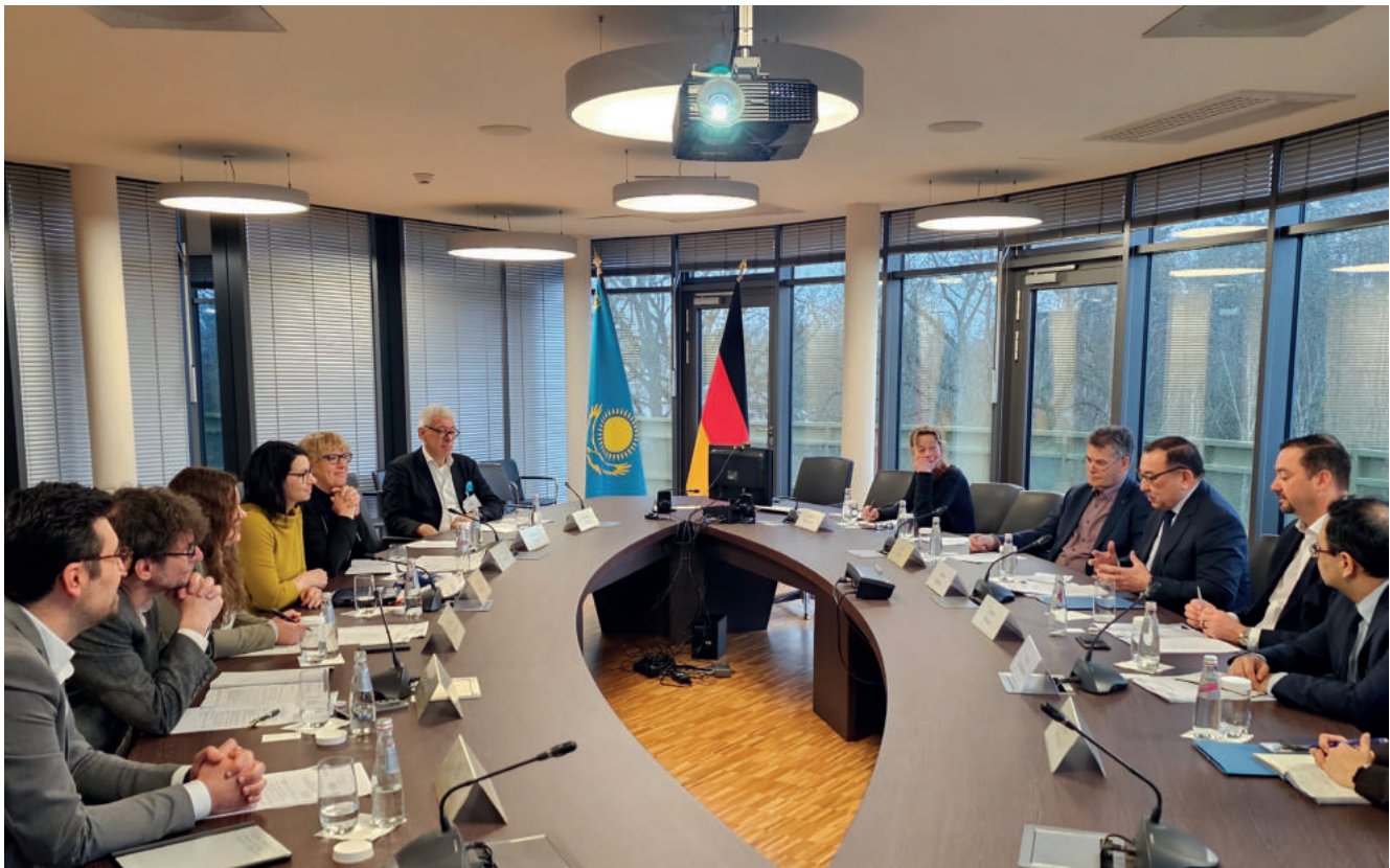
Rundtischgespräch zum Thema „Wasser als Grundlage globaler Sicherheit“ in der Botschaft der Republik Kasachstan, 25. März 2026, Berlin

Botschaft der Republik Kasachstan in der Bundesrepublik Deutschland Tel.: +49 30 470 071 11 E-Mail: berlin@mfa.kz www.gov.kz