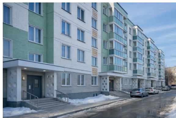
Von der Instandsetzung zur umfassenden Modernisierung: Komfort, Energieeffizienz und Nachhaltigkeit (links: Mehrfamilienhaus in Kasachstan, rechts: Simulation eines umfassend modernisierten Mehrfamilienhauses)