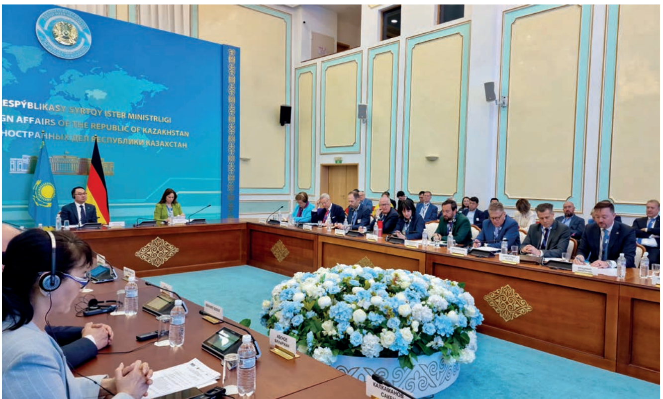
46. Sitzung des Berliner Eurasischen Klubs (BEK) in Astana

Die 46. BEK-Sitzung hat gezeigt, dass der Klub, der früher häufig vor allem als Plattform des politisch-wirtschaftlichen